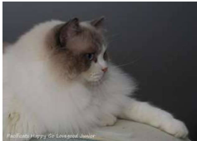
Foto: Pacificats Happy Go Lovegood Junior van Liesbeth van Mullem en Willem-Jan van den Eijkhof