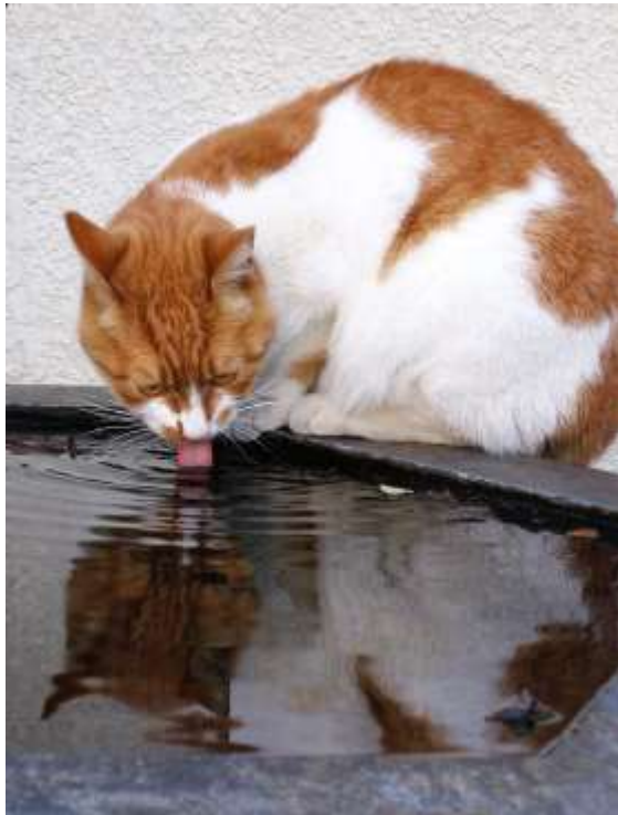
Drinkende kat